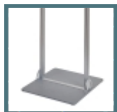
Base quadrata in metallo ultrapiatta da mm. 6, dim. mm. 325x325 verniciata a polveri color silver

Possibilità di personalizzare l'espositore con un pannello in forex tra i montanti.