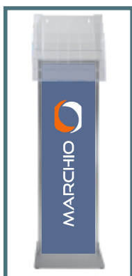
Pannello in forex con stampa fronte/retro